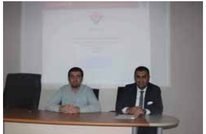
Yüksekova MEM, TÜBİTAK 4006 Öğretmen Eğitimi

öğrencilerimizin bu projelere etkin katılımı sağlanmıştır. Eğitimlerde öğretmenlerimize proje hazırlama, örnek projeleri gösterme, projelerin kabulü ile ilgili çeşitli bilgiler verilmiştir. Süreç devam ederken de öğretmenlerimizle birebir görüşmeler yoluyla projeleri ile ilgili düzeltmeler yapılmış ve projelerin kabulü yüksek oranda sağlanmıştır.