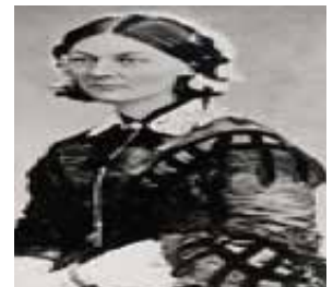
Modern hemşireliğin kurucusu Florence Nightingale

izlenimlerle 1911'de altı ay sürecek olan ve gönüllü kadınların katıldığı hasta bakıcı kursları açmıştır. Bu kurslarda sertifika almaya hak kazanan kadınlar, 1912'de Balkan Savaşı'nda yaralı askerlerin bakım ve tedavilerine katılmıştır. Bu sayede ülkemizde